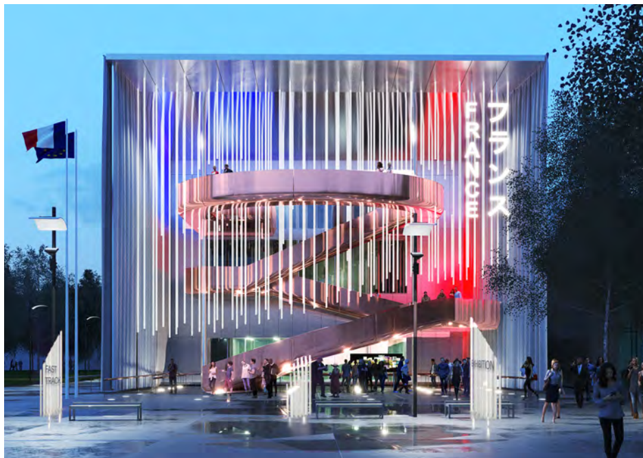
Façade du Pavillon France